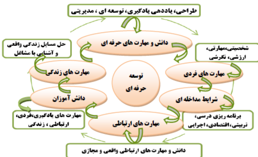
شکل ۱: الگوی تلفیق یافته تربیت معلم استم محور

نتایج حاصل از تحلیل یافته‌های پژوهش‌ها در ارتباط با یادگیری استم محور دانشجومعلمان در شکل (۱) ارائه شده است که ارتباط ابعاد اصلی و فرعی الگوی یادگیری استم را نشان می‌دهد.