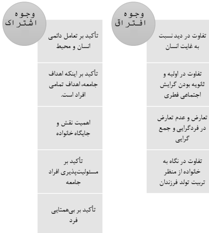
شکل (۴) وجوه اشتراک و افتراق رویکرد آدلری و مبانی جامعه‌شناختی تربیت رسمی و عمومی

- علی‌رغم آن که هر دو دیدگاه به اهمیت خانواده و چارچوب آن توجه خاصی نموده‌اند، ولی آدلر ترتیب تولد فرزندان خانواده را عامل مهمی در شکل‌گیری شخصیت افراد می‌داند؛ به گونه‌ای که از نظر وی فرزندان اول خانواده به احتمال زیادی در بزرگسالی بزهکار خواهند شد. در مبانی جامعه‌شناختی تربیت رسمی و عمومی سند تحول بنیادین، ترتیب تولد فرزندان مورد توجه قرار نگرفته است؛ و به صورت کلی نقش والدین را نسبت به تربیت فرزندان دارای جایگاهی والا می‌داند. شکل ۴ نقشه‌ای کلی از وجوه اشتراک و افتراق دیدگاه‌های مذکور را نشان می‌دهد: