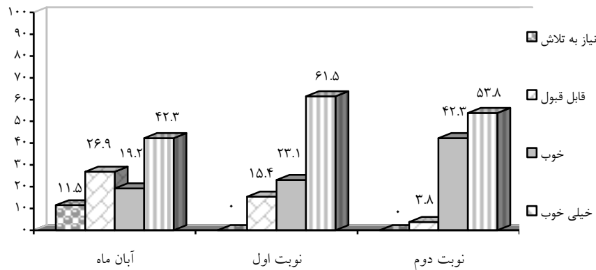
شکل (۲) نمودار ستونی درصد فراوانی نمرات درس ریاضی دانش‌آموزان در آبان ماه، نوبت اول و نوبت دوم

همانطور که مندرجات جدول و شکل (۲) نشان می‌دهد، تعداد دانش‌آموزانی که نمرات خیلی خوب و خوب گرفته‌اند در نوبت دوم (خرداد ماه) نسبت به اوایل سال تحصیلی (آبان ماه) افزایش داشته است.